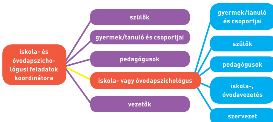
1. ábra: Az iskola- és óvodapszichológusok, valamint a koordinátoruk kliensi hálójá

A különböző nevelési-oktatási intézmények eltérő arányban igénylik a különböző klienscsoportokkal való foglalkozást, azonban az iskola- és óvodapszichológusi munka hatékonysága sokszor éppen azon múlik, hogy bevonjuk-e a problémamegoldásba az érintettek teljes körét, vagy támaszkodunk-e azokra az erőforrásokra, amiket a pedagógusok, az osztálytársak vagy a család bevonásával érhetünk el. A kliensek teljes körével való munkamód kialakítása egy intézményben hosszabb idő, sok esetben egy-két év munkájának eredménye, és az iskola- és óvodapszichológus szakmai tapasztalatával és képzettségével összefüggést mutat. Bármelyik kliensréteg esetén (gyermek, tanuló, szülő, pedagógus) a kevés tapasztalattal rendelkező pszichológus számára kedvezőbb, ha egyéni helyzetekben próbálja ki kompetenciáit először, ezután lép tovább a csoporttapasztalatok felé. Fiatalabb gyerekekkel megvalósított tanácsadás során általában könnyebb elsajátítani a szakmai készségek elemeit, mint serdülőknél, diákok körében könnyebb a gyakorlás, mint felnőttek társaságában. Tanácsadási helyzetekben az aktívan kommunikáló (játsszó, rajzoló) klienssel könnyebb a szakma elemi fogásait tanulni, mint a passzív vagy ellenálló kliensnél. Szakmai szempontból indokolt a fokozatosság a feladatkörök, ezen belül a klienskör felvállalásában is. A pszichológus speciális érdeklődése vagy többéves szakmai tapasztalata képes felülmúlni az előbbieken felvázoltakat. 3